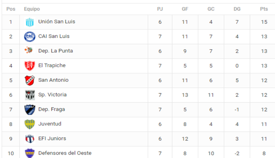
Tabla General 2024

Con este triunfo, el CAI alcanza las 13 unidades en la tabla de posiciones, ubicándose en la segunda colocación de su grupo y demostrando su determinación por alcanzar sus objetivos en esta temporada. La solidez mostrada tanto en defensa como en ataque augura un futuro prometedor para el equipo, que continúa cosechando éxitos en su camino hacia la gloria en el Torneo de Primera División.