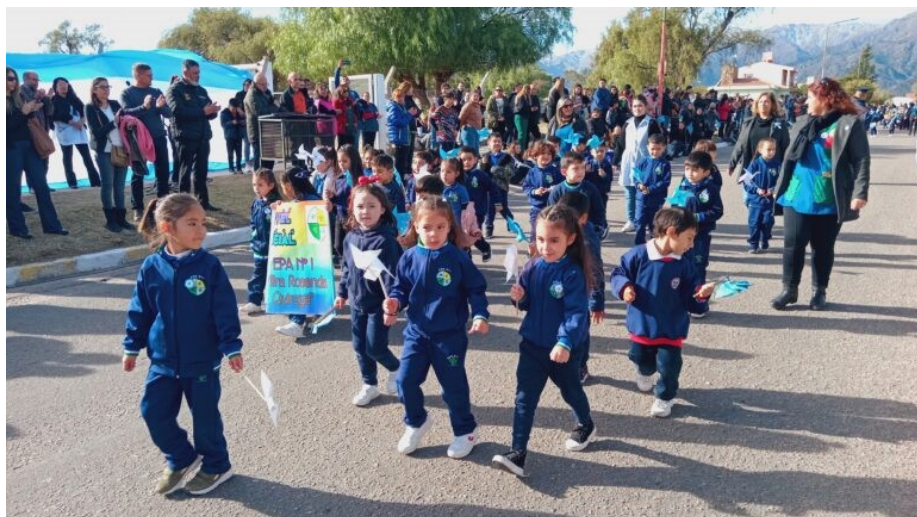
Jardín de infantes EPA Rosenda Quiroga La Punta

Ambos desfiles no solo conmemoraron una fecha histórica significativa, sino que también fortalecieron los lazos entre los distintos actores educativos, gubernamentales y la comunidad en general. Estos eventos se han convertido en una tradición esperada, promoviendo la unión y el orgullo patrio en La Punta y sus alrededores. Con actividades variadas y la participación de numerosas instituciones, la celebración de este año reflejó el espíritu de cooperación y el entusiasmo de la comunidad por mantener viva la memoria de la Revolución de Mayo.