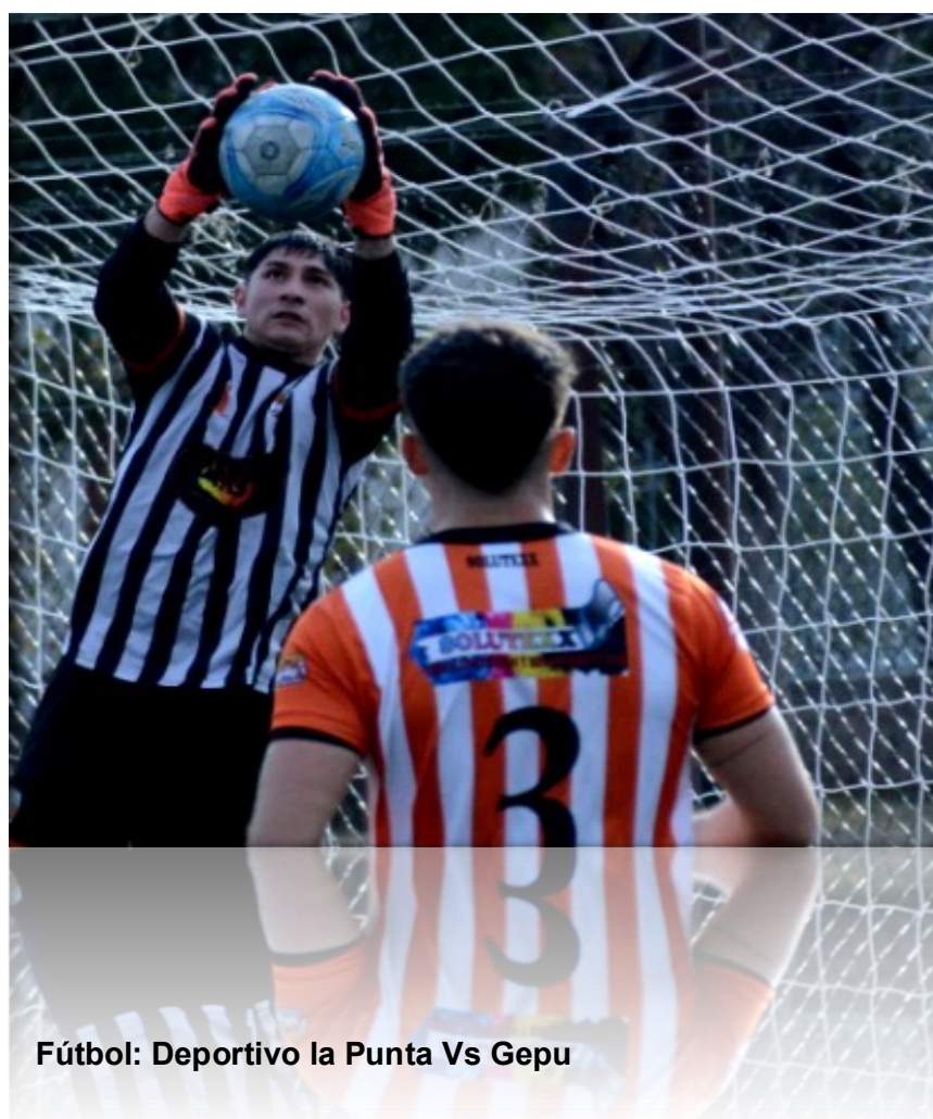
Fútbol: Deportivo la Punta Vs Gepu

En un inesperado giro en la competencia, Deportivo La Punta, conocido popularmente como El Naranja, prepara una protesta formal contra GEPU por la supuesta mala inclusión de un jugador en su equipo. La queja, que podría presentarse este mismo lunes, tiene el potencial de alterar significativamente la tabla de posiciones.