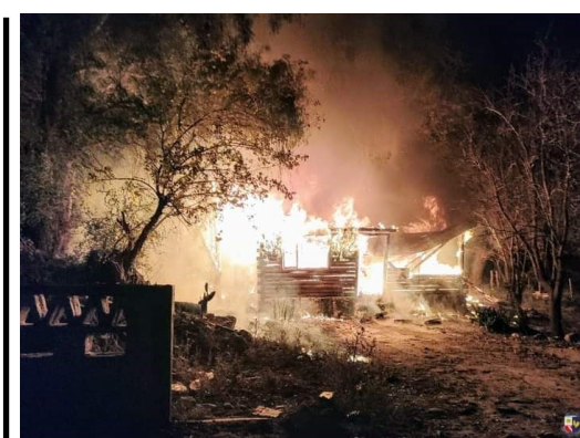
Incendio en vivienda de estilo cabaña en San Francisco del Monte de Oro