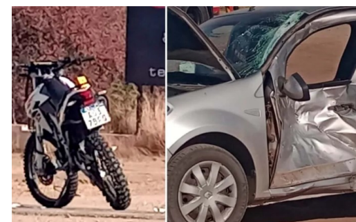
Grave accidente en el Ingreso a Merlo: Dos personas heridas de gravedad